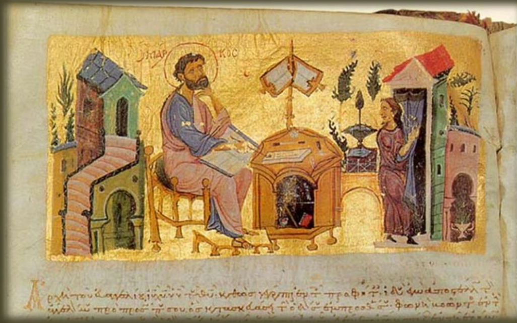
Преподобный Андрей Критский — миниатюра в рукописи XII века