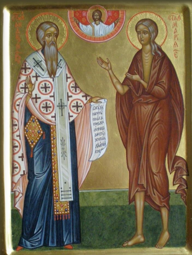
Святой Андрей Критский и преподобная Мария Египетская

Отцы пустынники и жены непорочны, Чтоб сердцем возлетать во области заочны, Чтоб укреплять его средь дольних бурь и битв, Сложили множество божественных молитв.