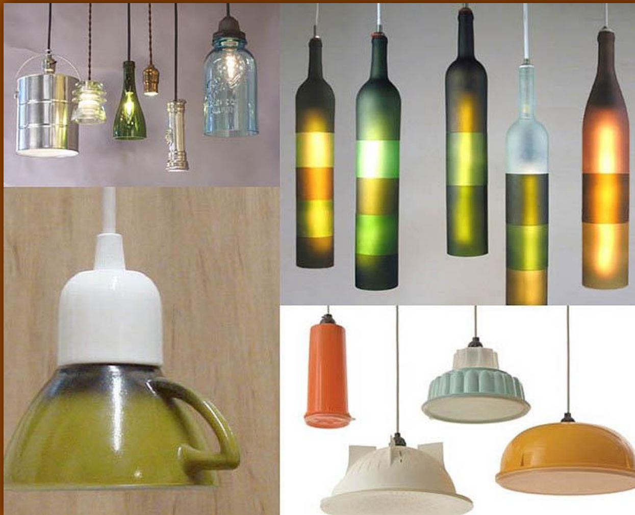
Светильники из старых чашек, бутылок и мисок.