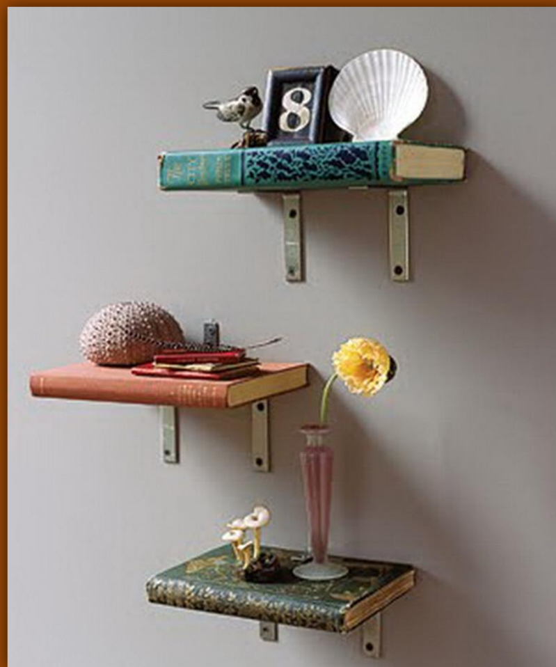
Полки из старых книг