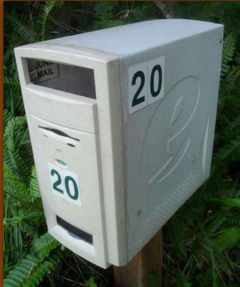
Почтовый ящик из старого корпуса от системника