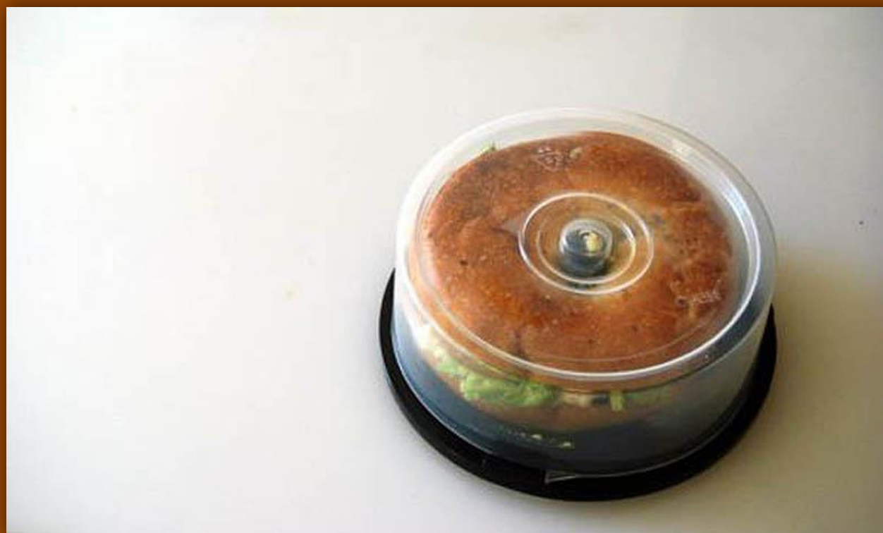
Контейнер для продуктов из старого футляра для CD-дисков