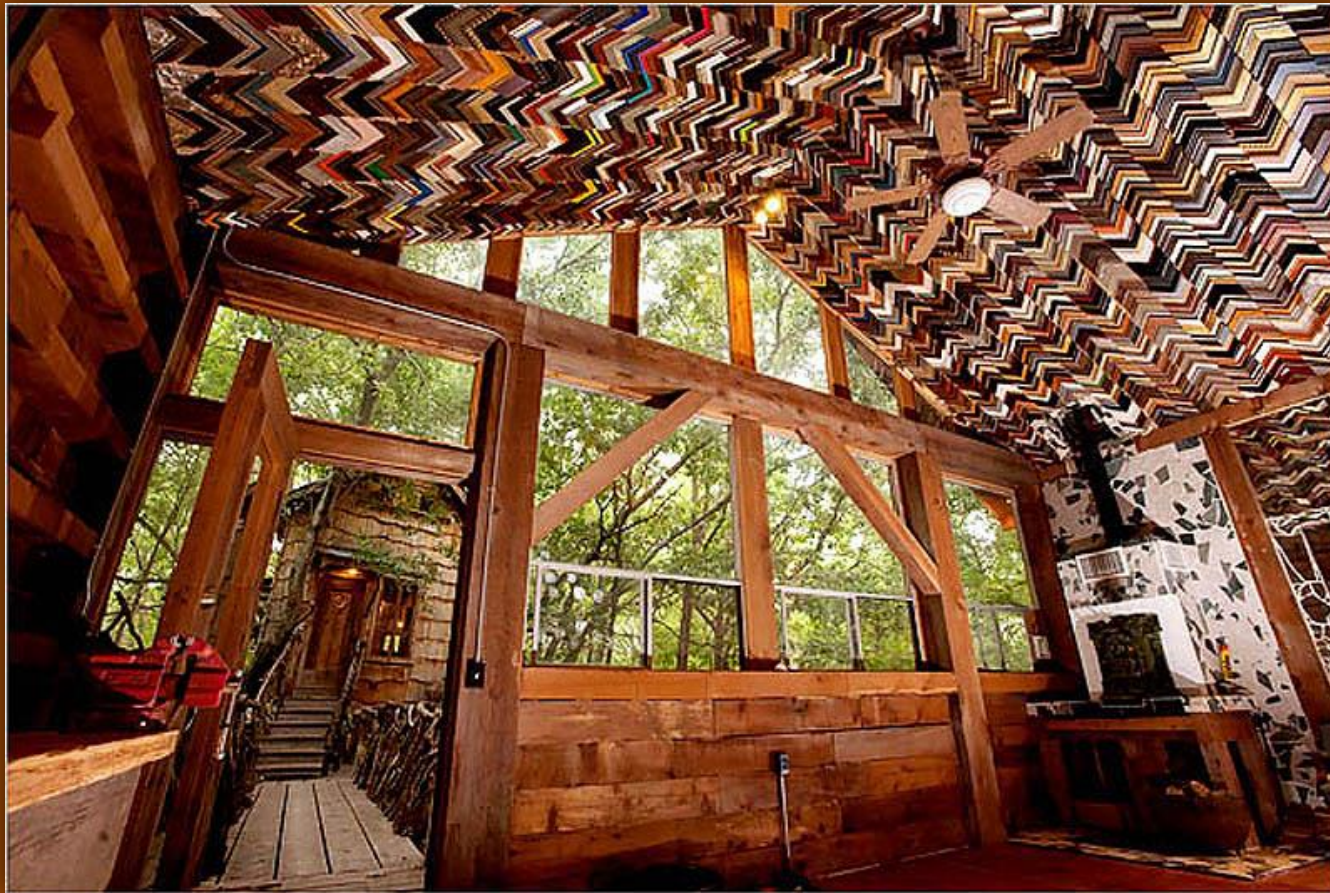
Старые уголки для рам в качестве плитки.