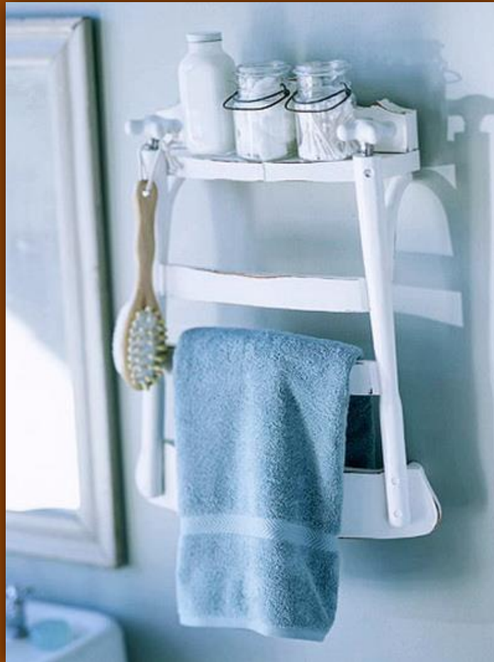
Оригинальная полка из старого стула.