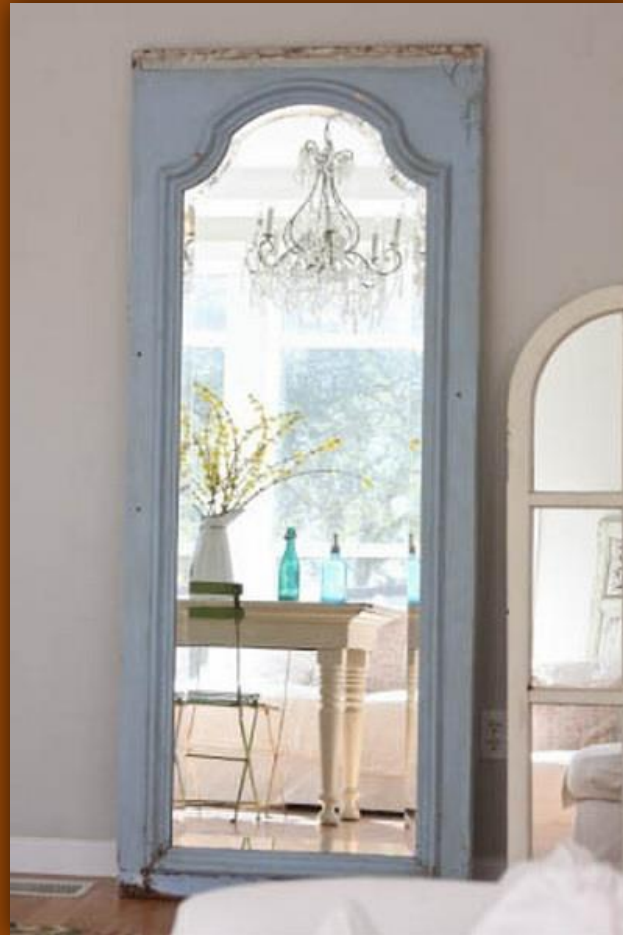
Рама для зеркала из старой двери.