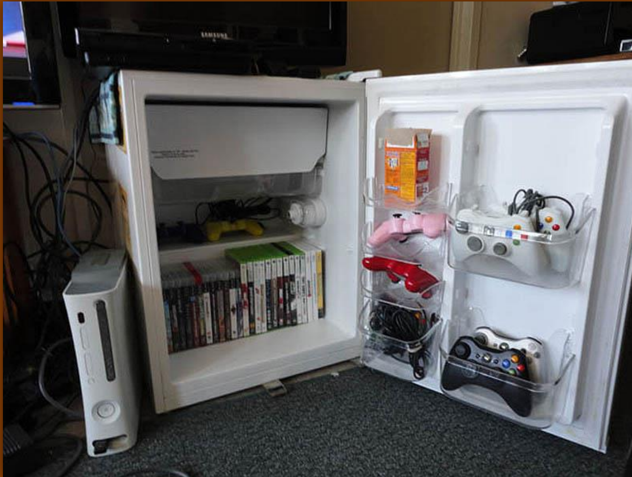
Старый мини-холодильник в качестве тумбочки для хранения разных аксессуаров.