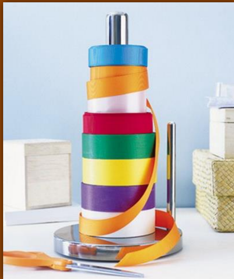
Держатель для ленточек из держателя для бумажных полотенец.