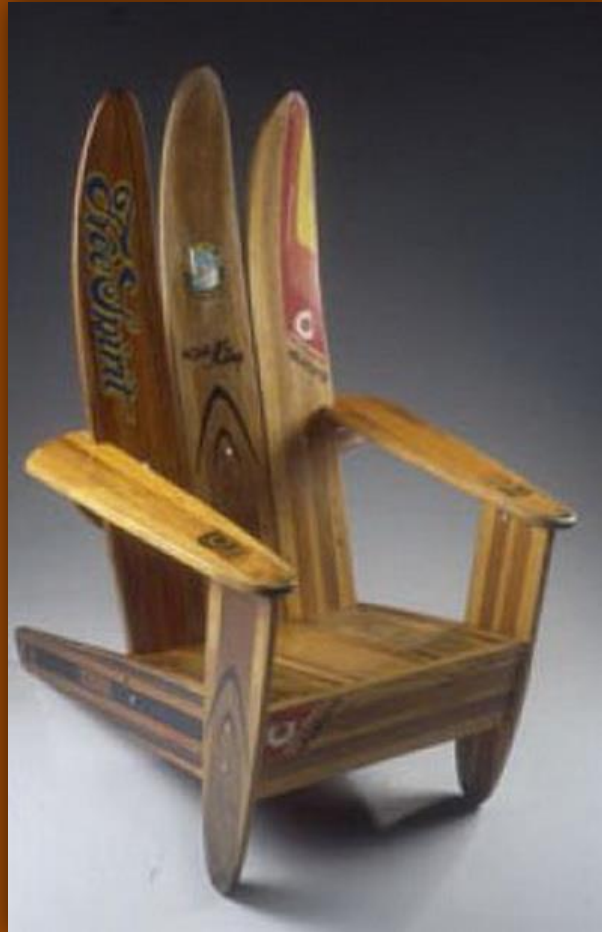
Стул из старых водных лыж