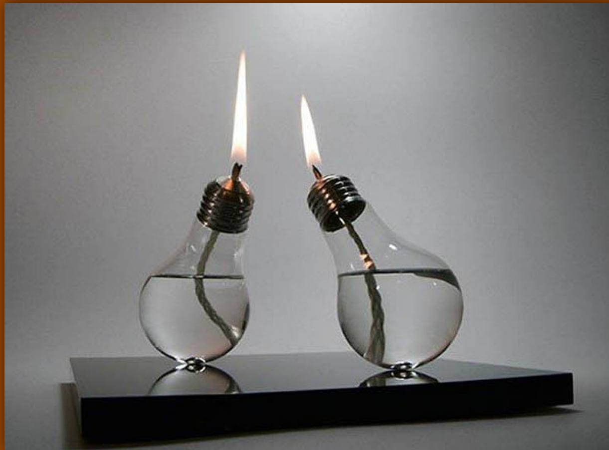
Необычные свечи из старых лампочек.