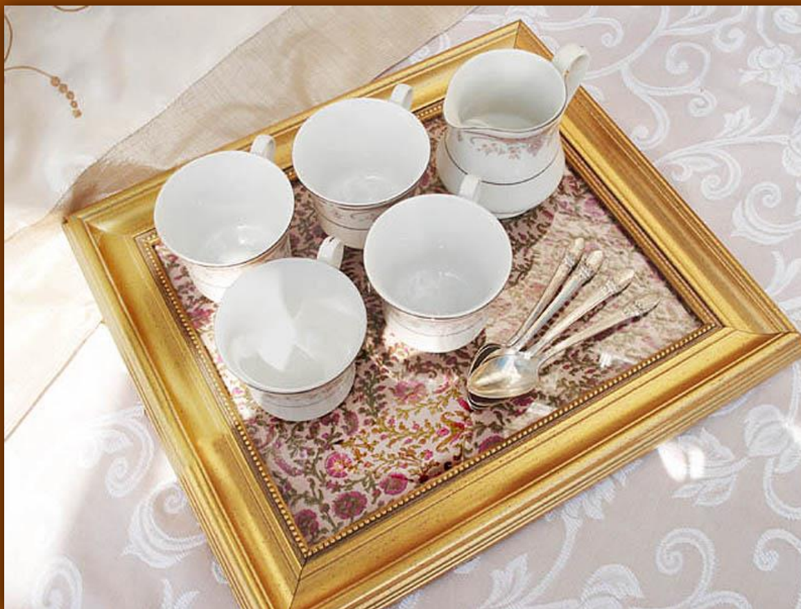
Поднос из старой рамки от картины