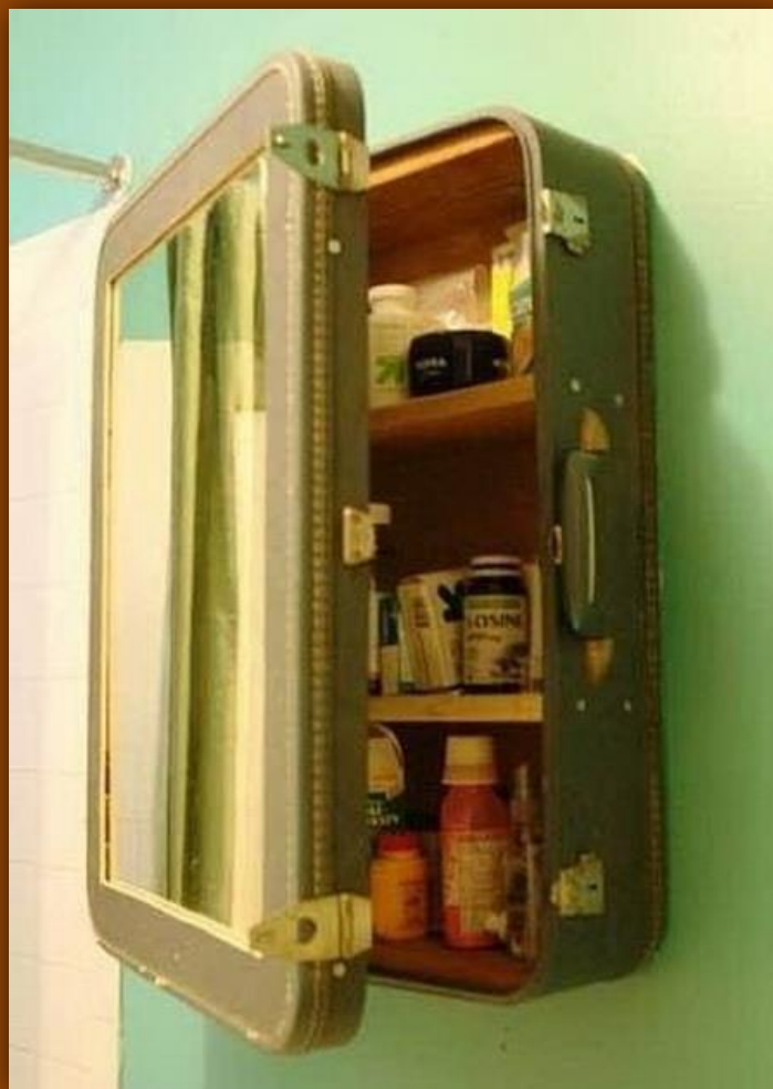
Аптечка из старого чемодана