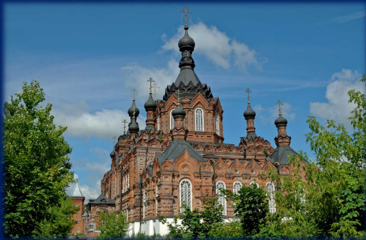
Шамордино. Казанская Амвросиевская женская пустынь

Незадолго до своей кончины, в 1884 году, отец Амвросий основал в 12 км от Оптиной Пустыни Шамординский женский монастырь .