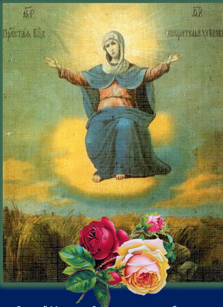
Икона Божией Матери «Спорительница хлебов», открытка

формате открытки с достаточной степенью достоверности передают и краски живописного первообраза.