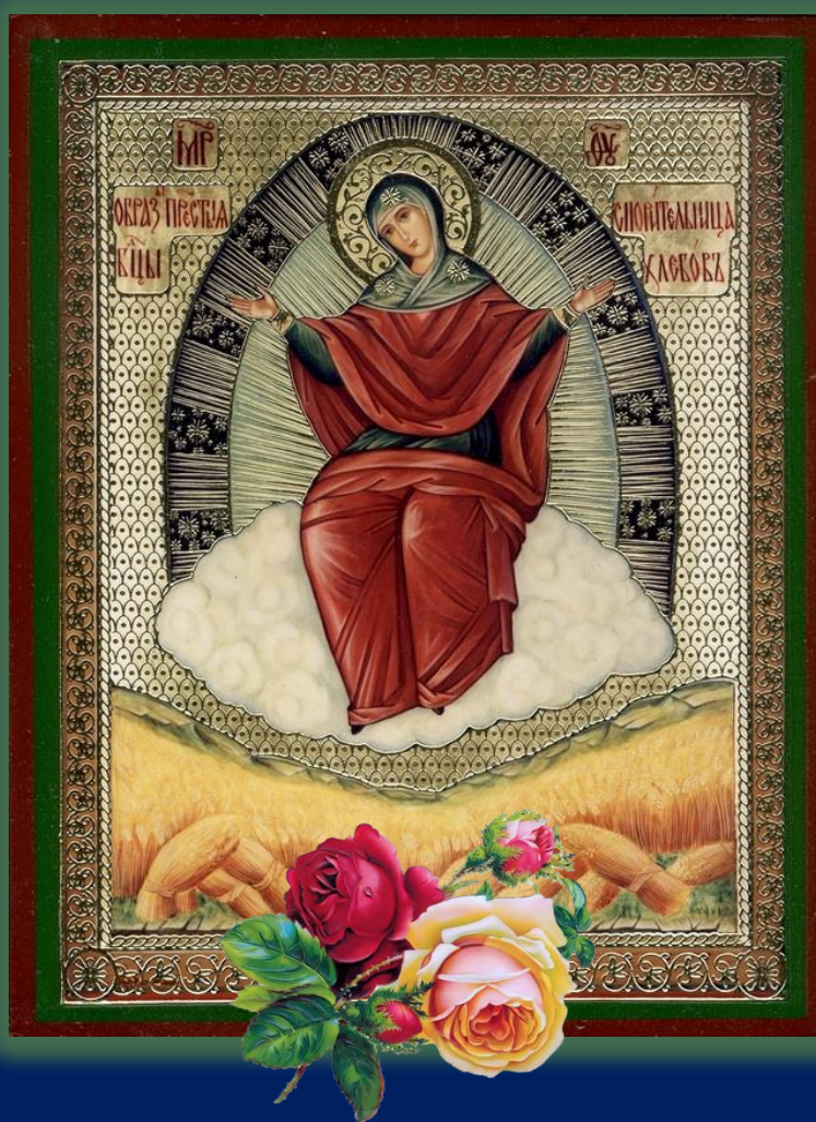
Икона Божией Матери «Спорительница хлебов» Новейшая иконография. Софрино

На большинстве же современных икон Богоматерь, сидящая на облаке с воздетыми в молении руками над хлебным полем, чаще всего, окружена овальной мандорлой-сиянием, пронизанной лучами и украшенной по внешнему краю звездами.