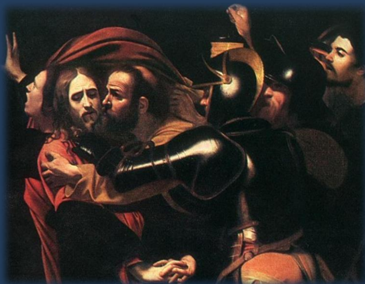
Поцелуй Иуды. Караваджо

Нередко нам тоже бывает легче даже простить кого-то, чем себя. Трудно бывает принять прощение, позволить Богу себя любить, потому что сами мы к себе относимся часто очень скверно. Но одновременно это может мешать нам быть ближе ко Христу, который хочет нас прощать, чтобы восстановить с нами близкие личные отношения. Потому что для Него они точно имеют ценность. Имеют ли для нас? Настолько, чтобы мы были готовы с легкостью и радостью принимать Его прощение, только бы быть с Ним.