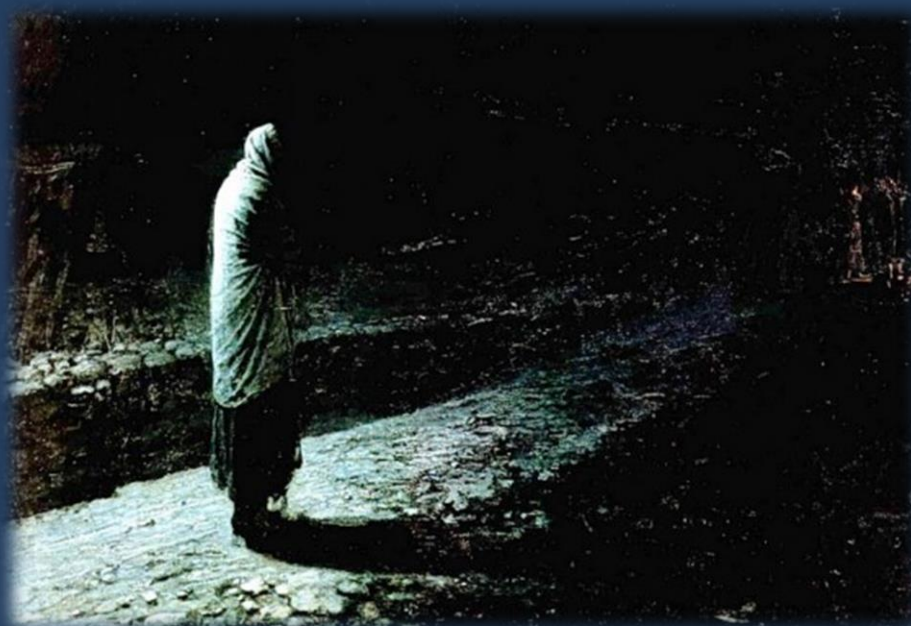
Николай Ге. "Совесть. Иуда"

Когда настала Тайная вечеря, и все сидели (вернее – возлежали), Иуда встал и ушел, и это никого не удивило, то есть, видимо, такое бывало уже ранее, поэтому учеников это не смутило. Имел ли Иуда отношения в общине? Отношения любви с теми, кому можно отдавать и с кем можно разделять. А каковы наши отношения с ближними?