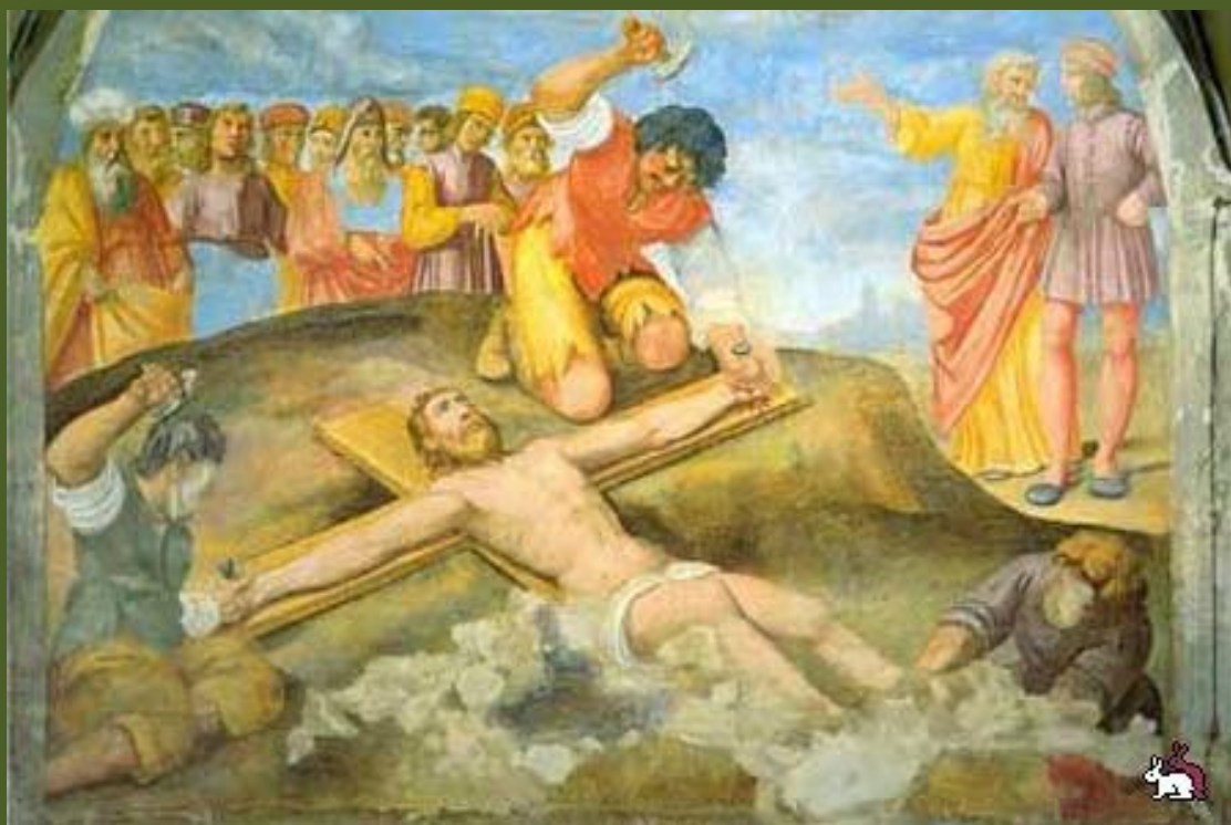
Распятие святого апостола Петра

Сохранились многие из тех камней, которыми убили святого Стефана, и основание креста из Рима, на