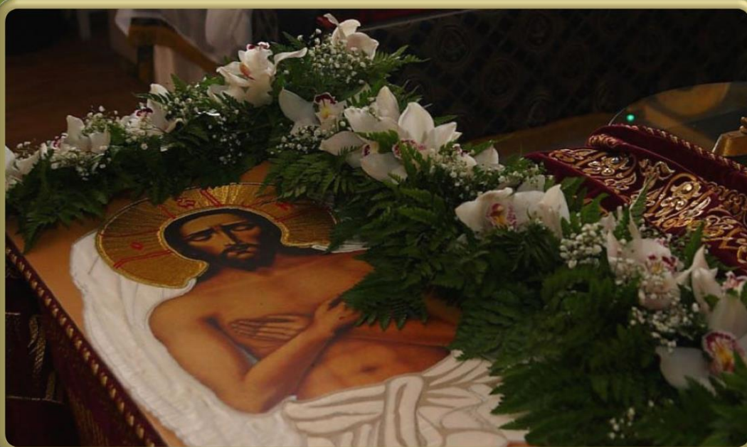
Вынос плащаницы в Страстную пятницу

Когда звучат эти тексты евангельские, когда поются песнопения чудесные, когда священник совершает каждение, поклоны, когда все объаты единым духом этого богослужения, когда всё так пронзительно – народ не может удержаться от переживаний. Как на Пасху нельзя удержаться от радости, так и тут нельзя удержаться от переживаний.