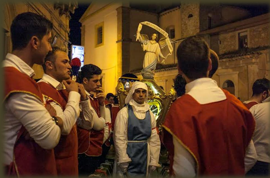
Страстная на Сицилии.

– Насколько я знаю, у католиков такое чувственное сопереживание страданиям Христа очень распространено, крестный ход в Великую Пятницу они посвящают именно этому – прочувствовать страдания Христа. У нас, в православной традиции, акцент больше на события Страстной седмицы: что происходит с людьми вокруг Креста.