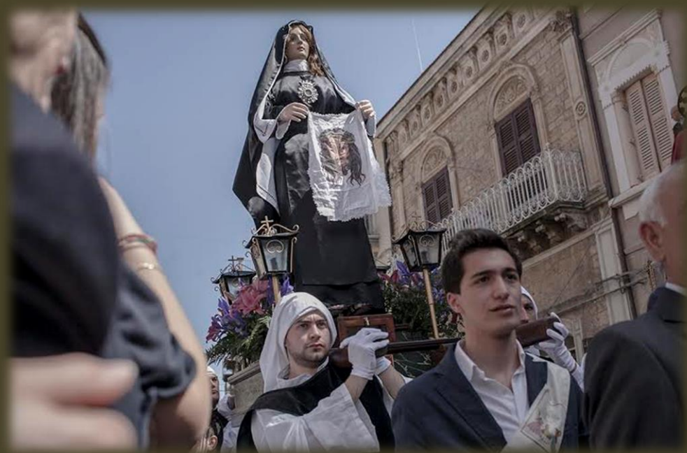
Страстная на Сицилии.