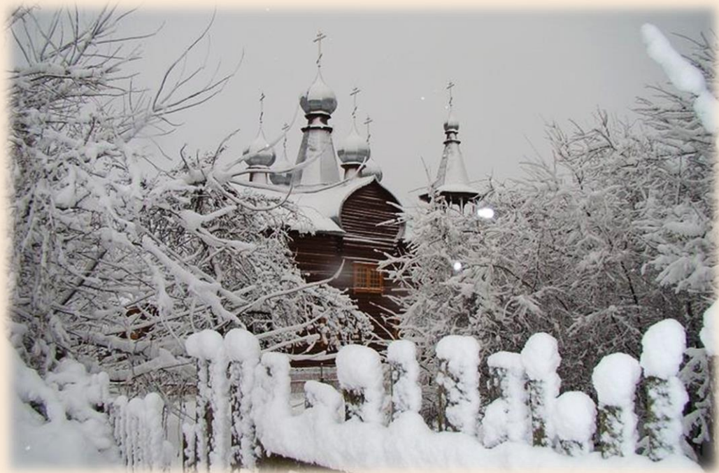
Храм в Подборках