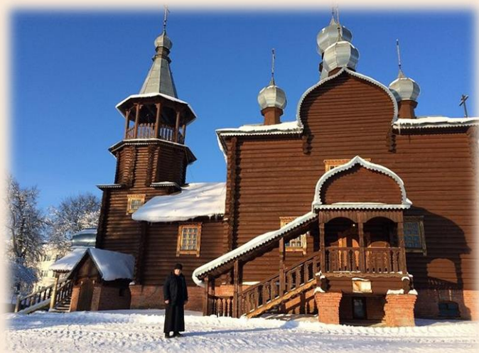
Храм Успения в селе Озерском (Подборках)

Новый храм, возведенный всем миром, тоже красавец, но уже совсем другой – бревенчатый терем с семью куполами, устремивший серебряные кресты в облака. Засмотришься, бывает, на него и замрешь, будто бы чудесным образом оказался в древней Руси. Новый храм гораздо меньше старого, он однопрестольный.