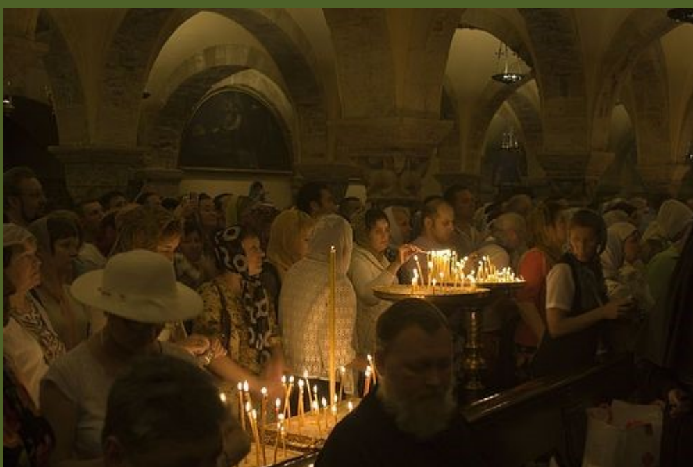
Православная литургия в день памяти свт. Николая

ние прежде ходивших в это храм к Московскому Патриархату весьма негативное. За все последние годы эти люди ни разу не пришли к нам на богослужения, хотя у них нет сейчас своего священника. Не приходят даже на Пасху, предпочитая ее встречать дома даже в тот момент, когда под их окнами идет наш крестный ход. Эти люди не исповедуются и не причащаются. Но я надеюсь, что эта проблема будет решена миром и что храм Русской Православной Церкви будет желанным местом и для паломников из зарубежной диаспоры.