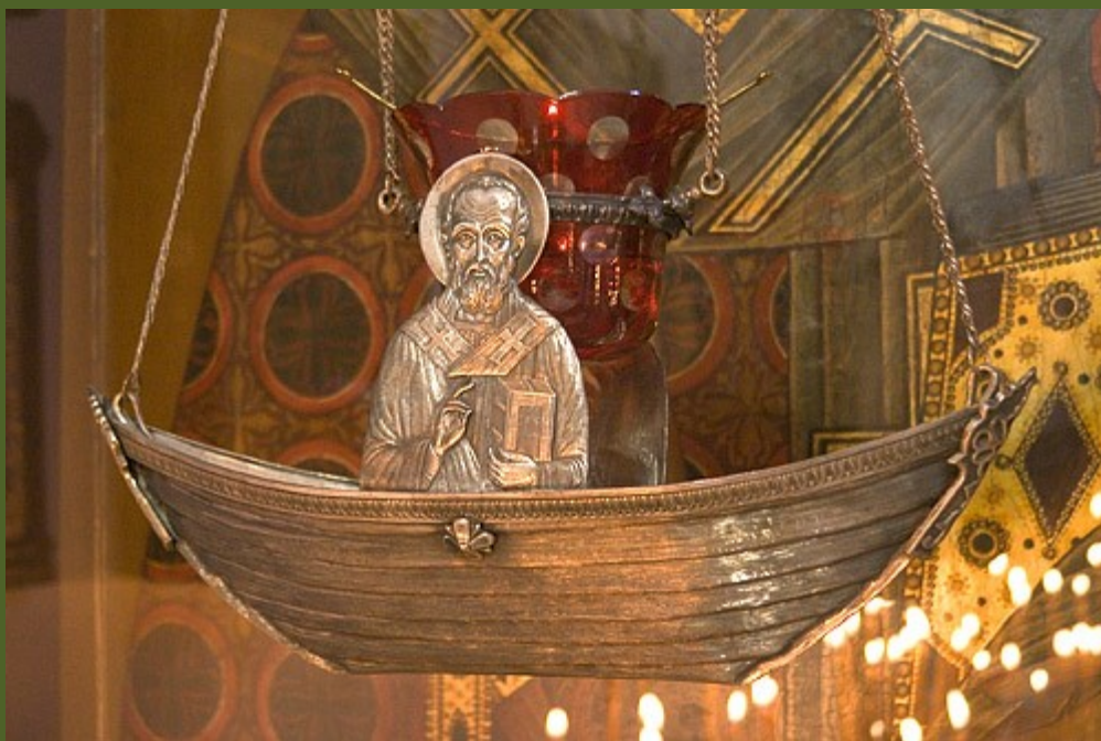
Лампада в виде корабля перед чтимой иконой свт. Николая