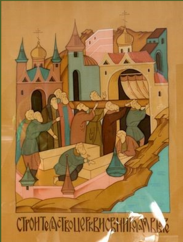
Строительство церкви свт. Николая в Бар-граде