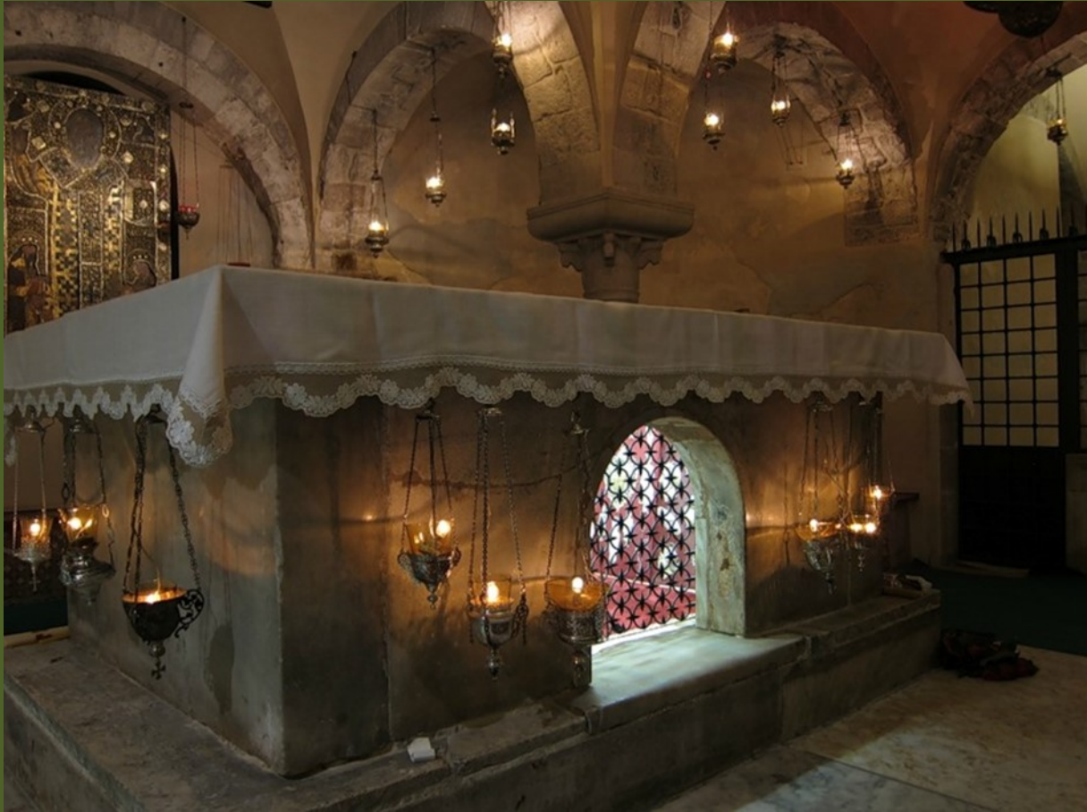
Престол над Мощами Святителя Николая