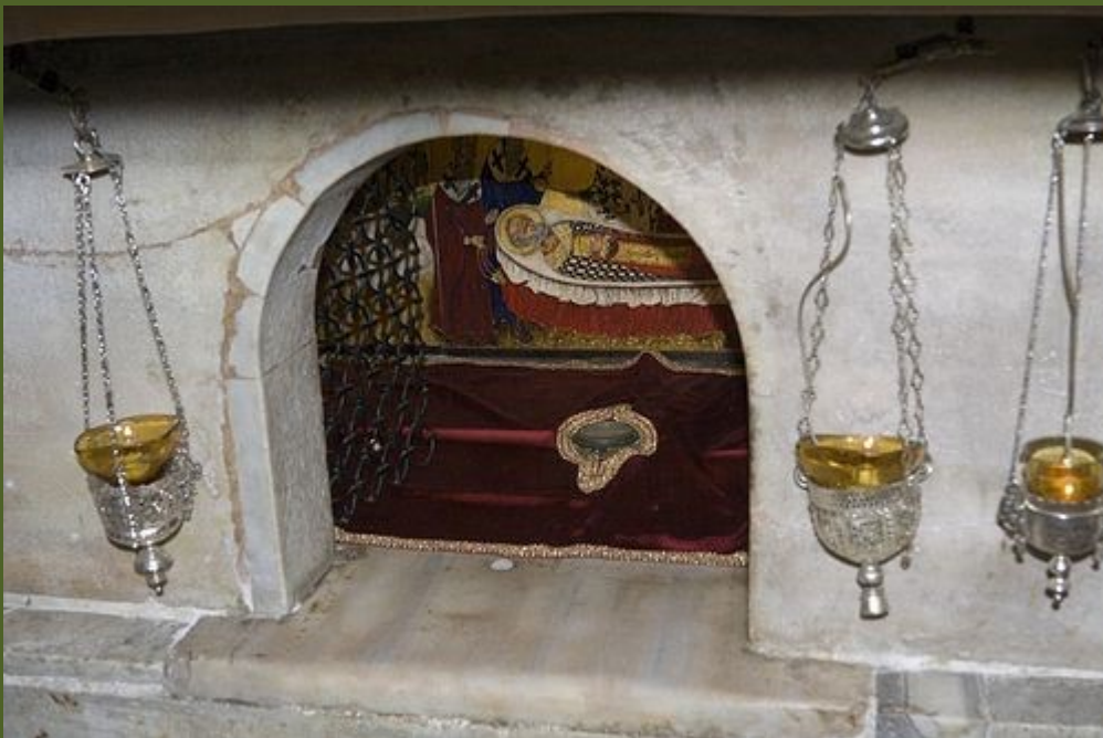
Мраморный престол над мощами свт. Николая в крипте базилики.

верующие которой всегда ощущают поддержку святого. Даже в кризис мы находим благочестивых людей, которые вносят свой вклад в этот праздник, так что мы имеем возможность пригласить в такие рейсы людей, которые другим способом никогда здесь не оказались бы: сирот, малоимущих и т. д. И это чрезвычайно важно – в дни памяти святителя Николая видеть в Бари весь срез нашего общества – от власть предержащих до абсолютно простых людей, которые молятся как братья у мощей святителя: у всех одни чувства в сердцах, одни слова на устах, у всех одинаково просветленные лица. Мне вспоминается название одной книги, посвященной паломничеству в Бари, – «Россия на коленях у гробницы святителя». Это очень точно передает происходящее здесь.