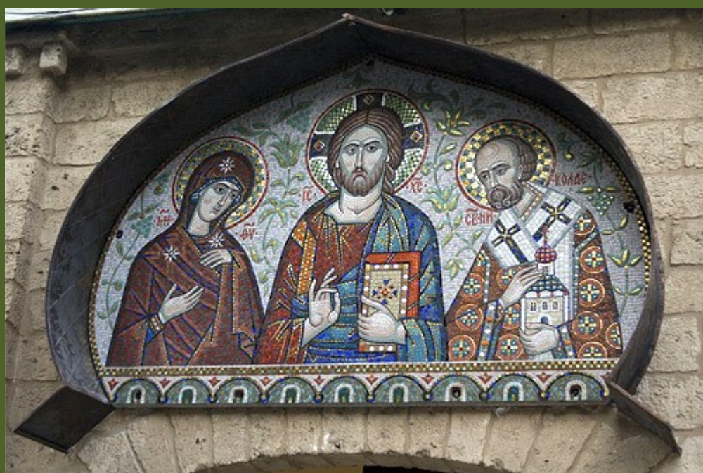
Мозаика над входом в русское подворье.

русского храма во имя святителя Николая Чудотворца в Бари. В следующем году мы с матушкой переехали в Италию. Здесь мне пришлось фактически с нуля при очень сильном противодействии представителей Зарубежной Церкви начинать свою деятельность по созданию прихода. Скоро так случилось, что наш приход оказался единственным уголком русской жизни в Бари. Тогда же были налажены очень тесные отношения с базиликой святителя Николая, где почивают его мощи, и мы получили эксклюзивное право на служение у святых мощей Чудотворца. И с тех пор ежедневно там служим. А подворье вместе с храмом стало базой для наших паломников и местом окормления русских людей в Бари.