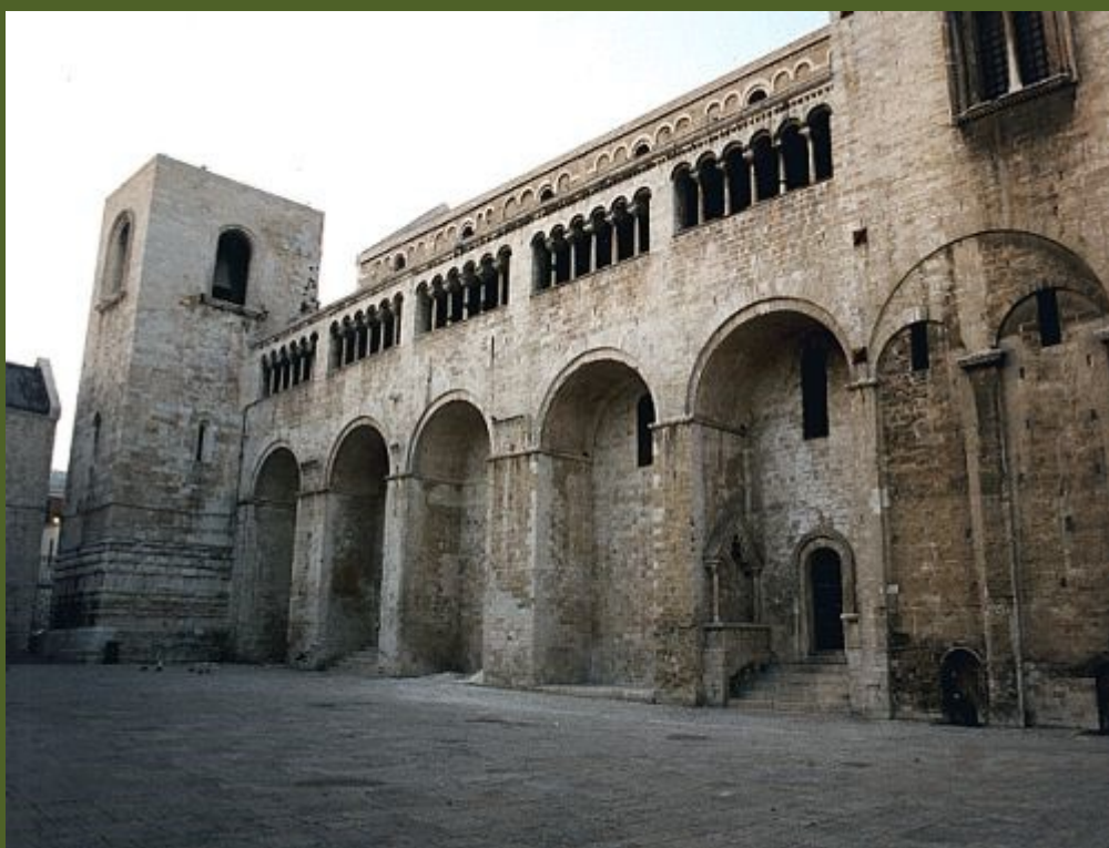
Базилика святителя Николая Угодника

В 1724 году Киевский пешеходец, а еще ранее, в 1698 году, у гробницы святителя Николая молились члены российского посольства во главе с Борисом Петровичем Шереметьевым. «Сей град Бар стоит на самом берегу моря, невелик, только крепостью очень крепок, и состоит под владением гишпанского короля», - отметил в путевом дневнике один из членов посольства по прибытии в Бари.