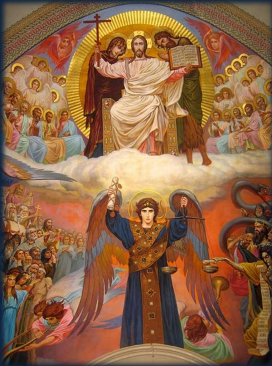
Второе Пришествие Христа. В. Васнецов