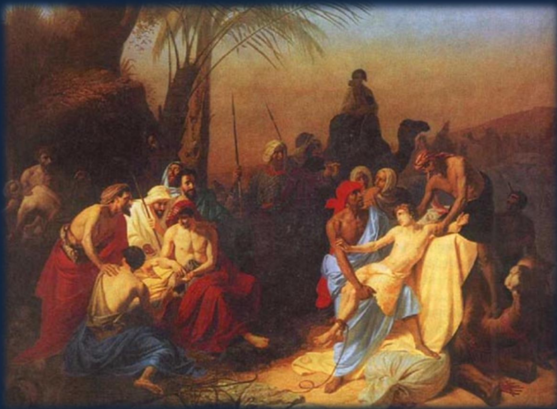
К. Флавицкий. Продажа Иосифа в рабство

В Великий понедельник мы вспоминаем ветхозаветного патриарха Иосифа, сына праотца Иакова и его любимой жены Рахили. Наделенный от Бога даром вещих снов (в которых он видел себя, возвышающимся над своей семьей), Иосиф вызвал зависть братьев. Они продали его в рабство в Египет, предъявив отцу испачканную кровью одежду, как будто брата растерзали звери.