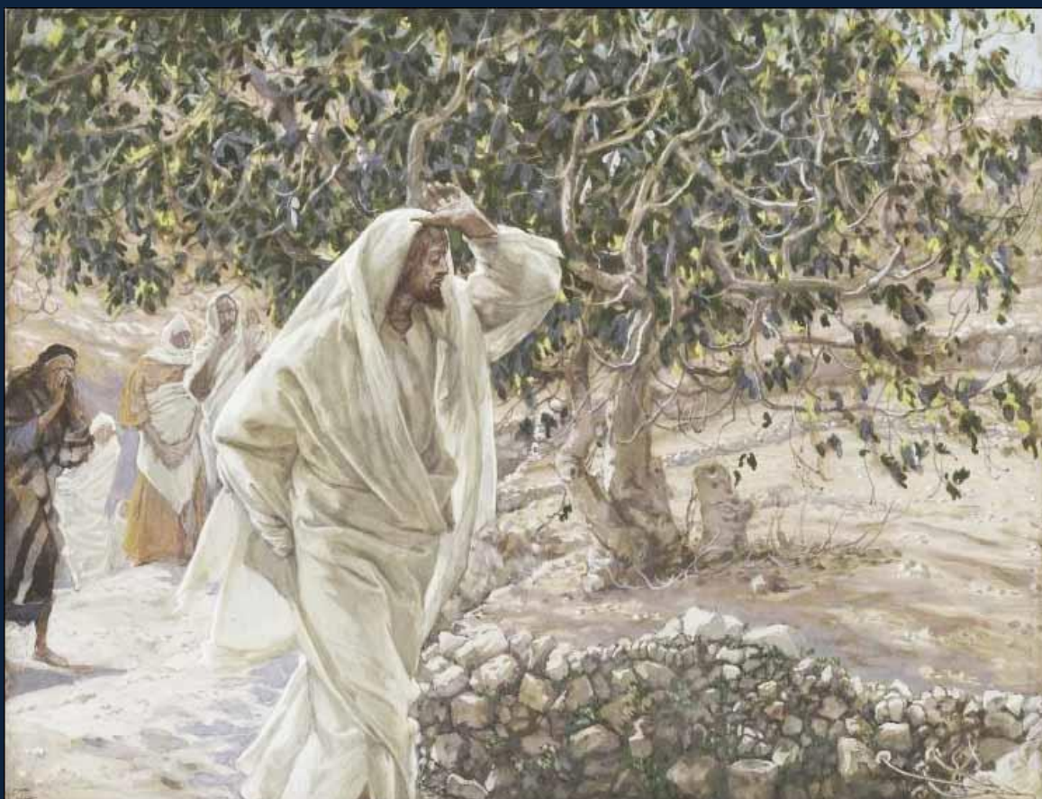
Ж. Ж. Тиссо. Проклятая смоковница

В этот же день Церковь вспоминает бесплодную смоковницу, проклятую Господом.