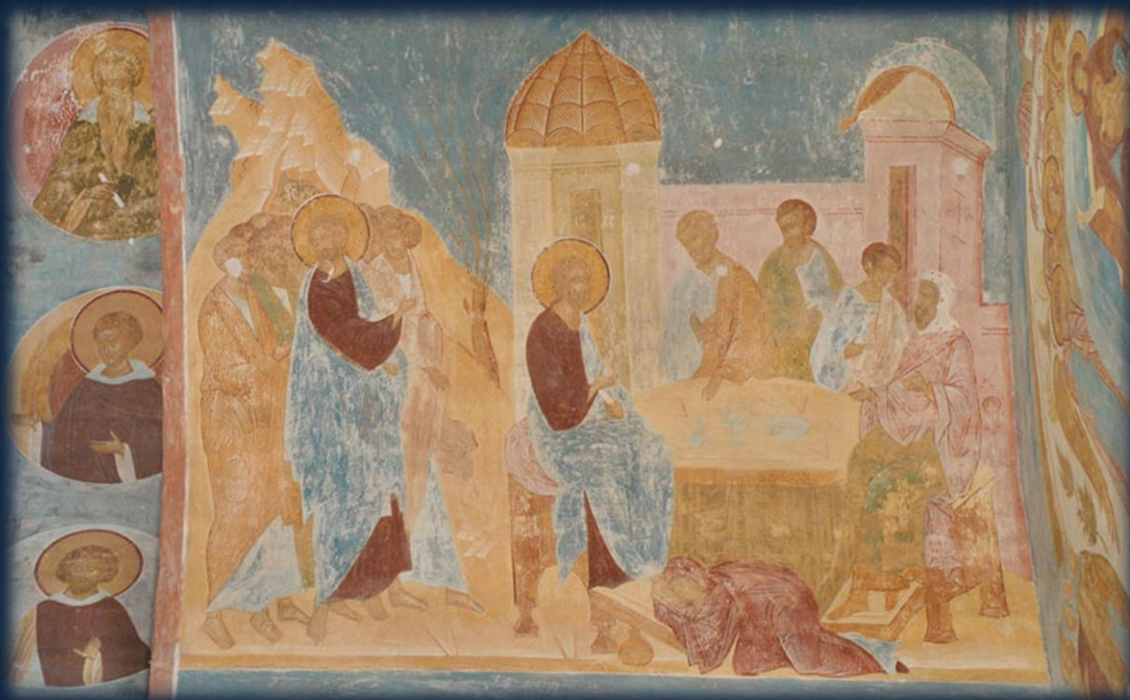
Дионисий. Пафнутьево-Боровский монастырь, фрагмент росписи. Слева “Проклятая смоковница”

Преподобный Ефрем Сирин , толкуя фрагмент о проклятой смоковнице, напоминает о ветхозаветной заповеди, согласно которой следовало оставлять на смоковнице плоды для сирот и бедных (ср.: Втор.24:19-21). «Господь... проклял ее, чтобы впредь не рождалось на ней плода по закону (естественному), так как она не исполнила закона (Моисеева)».