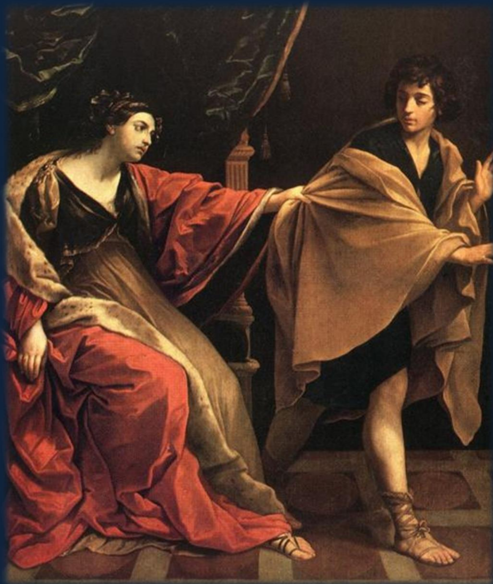
Г. Рени. Иосиф и жена Потифара

толковав сны фараона о грядущих годах сначала изобилия, а потом голода, стал вторым лицом в Египте.