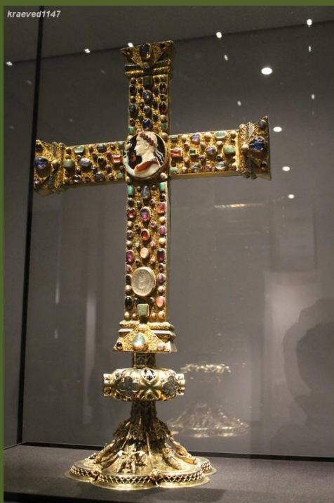
КРЕСТ ЛОТАРЯ – одна из ста- рейших святынь Аахена. Древ- ние ювелиры сделали его око- ло 1000 года из золота, поэ- лоченного серебра, самоцве- тов, жемчуга.