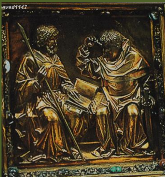
ПАНЕЛЬ АЛТАРЯ С АПО- СТОЛАМИ. Её создали ма- стера из Аахена в 1481 году