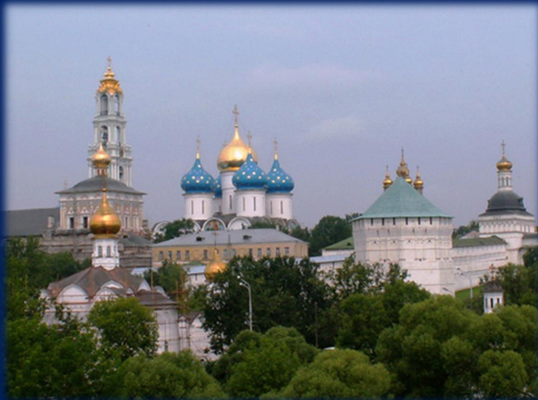
Троице – Сергиева Лавра

добного Сергия жизнь не полна – словно воздуха не хватает.