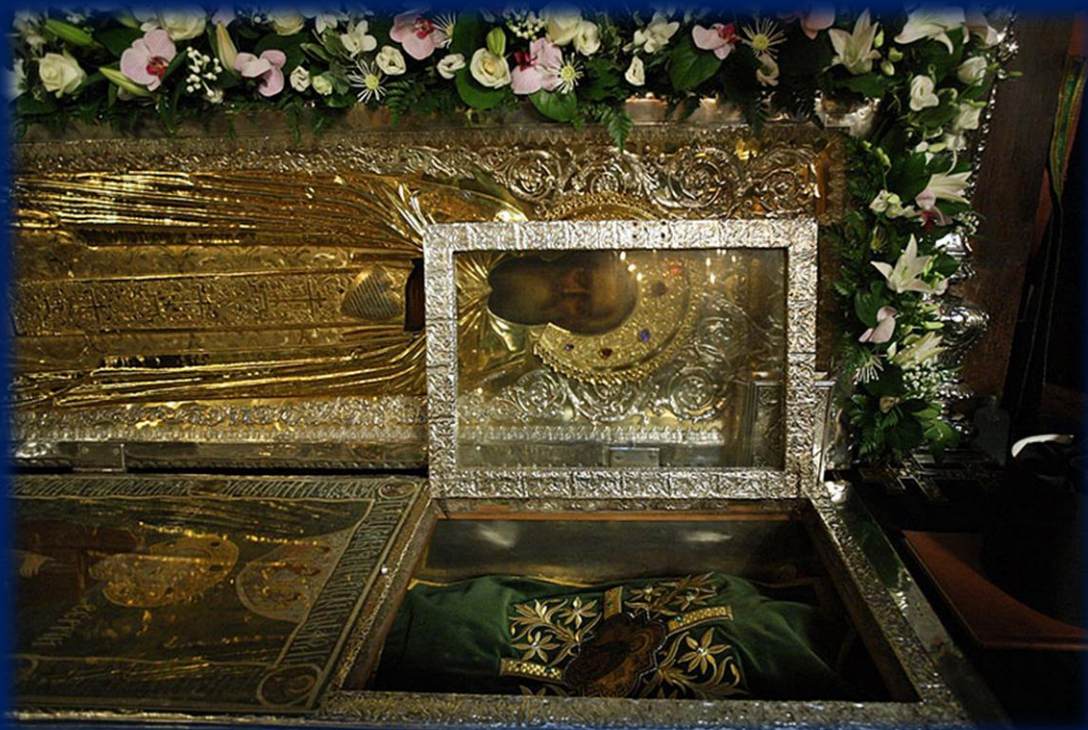
Мощи святого Сергия Радонежского

Кстати, очень значимый факт: наш брак с батюшкой мы оформили 18 июля, в день обретения честных мощей преподобного Сергия Радонежского. И как вы думаете, покровительствует он нашей семье или нет?